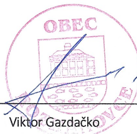
Viktor Gazdačko poskytovateľ